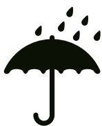
Vor Nässe schützen

Jegliche Kennzeichnung des Materials muss wetterbeständig sein bzw. gegen Witterungseinflüsse geschützt werden. Für die Kennzeichnung von Gütern, die einer besonderen Handhabung unterliegen, sind internationale Symbole anzubringen. Zum Beispiel: