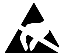
Elektrostatisch gefährdetes Bauelement